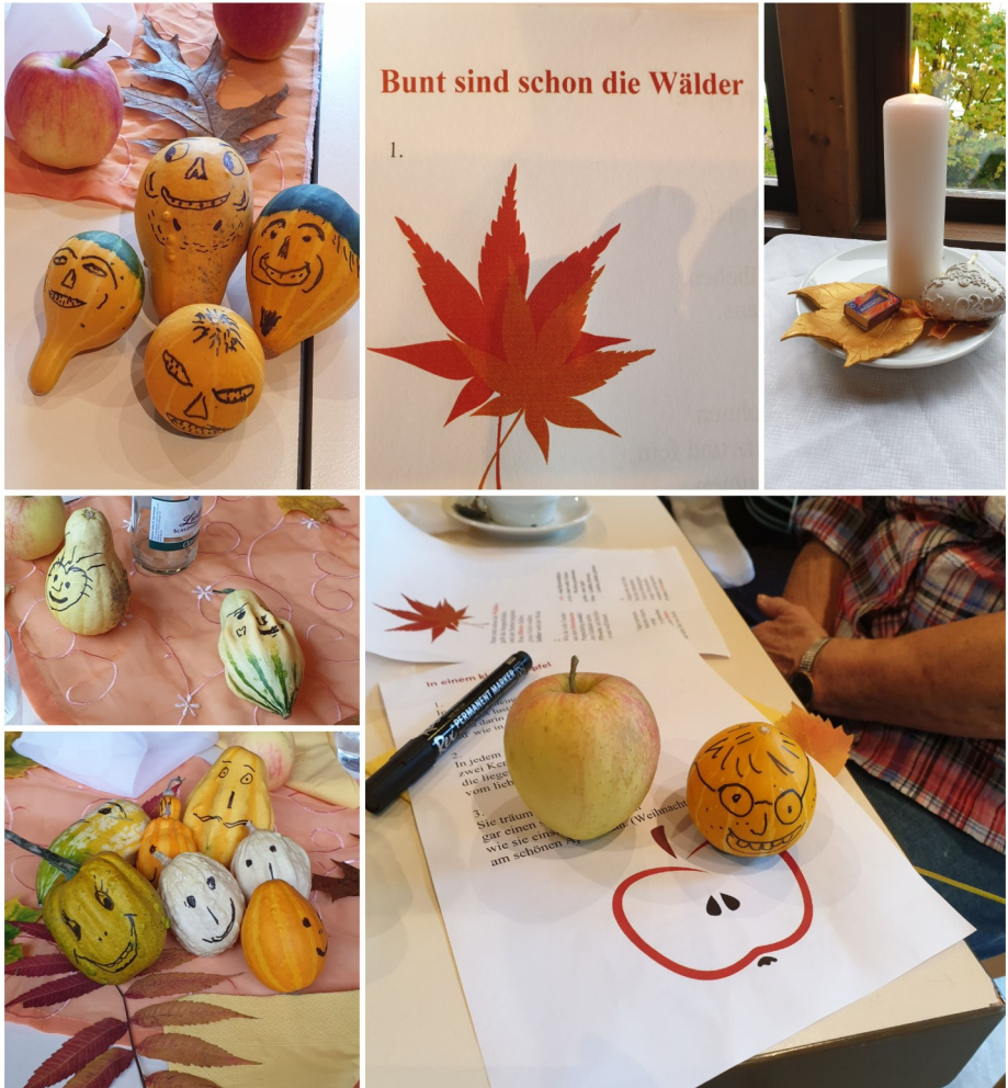
Bilder vom 1.Seniorenacmittag mit Frau Corinna Große