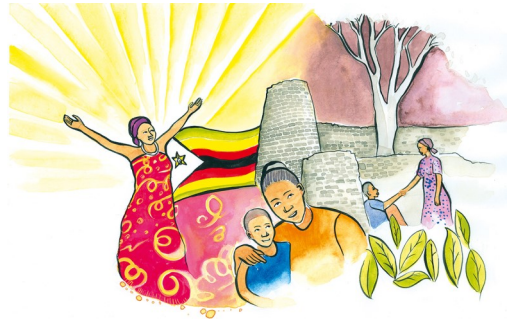
Bild: Nonhlanhla Mathe © Weltgebetstag der Frauen – Deutsches Komitee e.V.

In unserer Gemeinde wird der Weltgebetstag am 6. März im katholischen Bernhardsheim um 19.00 Uhr in Albrück gefeiert.